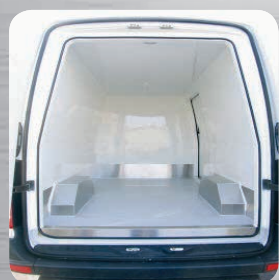
Seuil arrière et latéral poissonnier en option