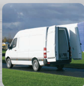
Contre-portes isothermes fixées sur les portes arrière d'origine