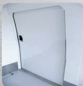
Porte latérale coulissante isolée en option