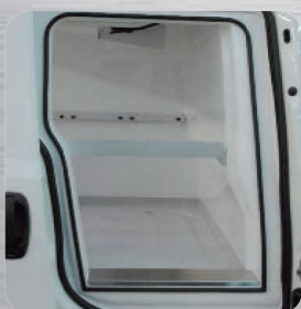
Accessibilité maximum avec porte latérale coulissante