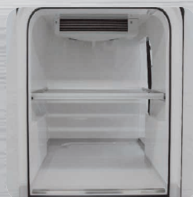
Nombreuses options personnalisées